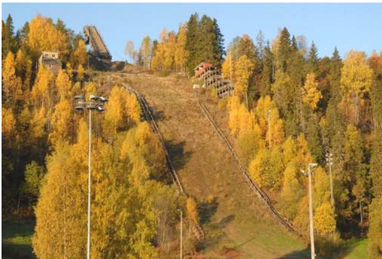
Skuibakken i høstfarger – Bakken var sentrum for kulturminnevandring i november 2009