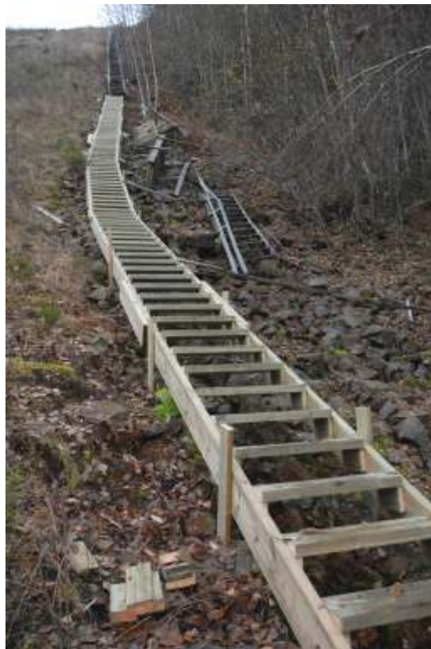
Nordre trimme og måletrapp under arbeid.

For alle utskiftninger og vedlikehold er det lagt vekt på samme utseende og materialdimensjoner som før.