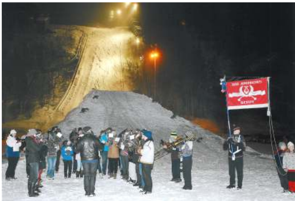
Skui Juniorkorps og Skui Brassband holder konsert etter innmarsj på sletta.

En stor takk også til alle hjelpere fra Bærum kommune, IL Jutul, våre to musikkorps Skui Juniorkorps og Skui Brassband, Røde kors og ikke minst de mange frivillige som sørget for at dette gikk smertefritt.