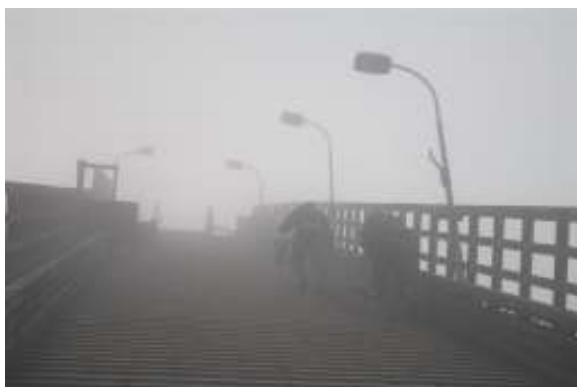
Lysgjengen på arbeid –