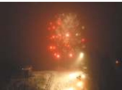
Fyrverkeri i Skuibakken