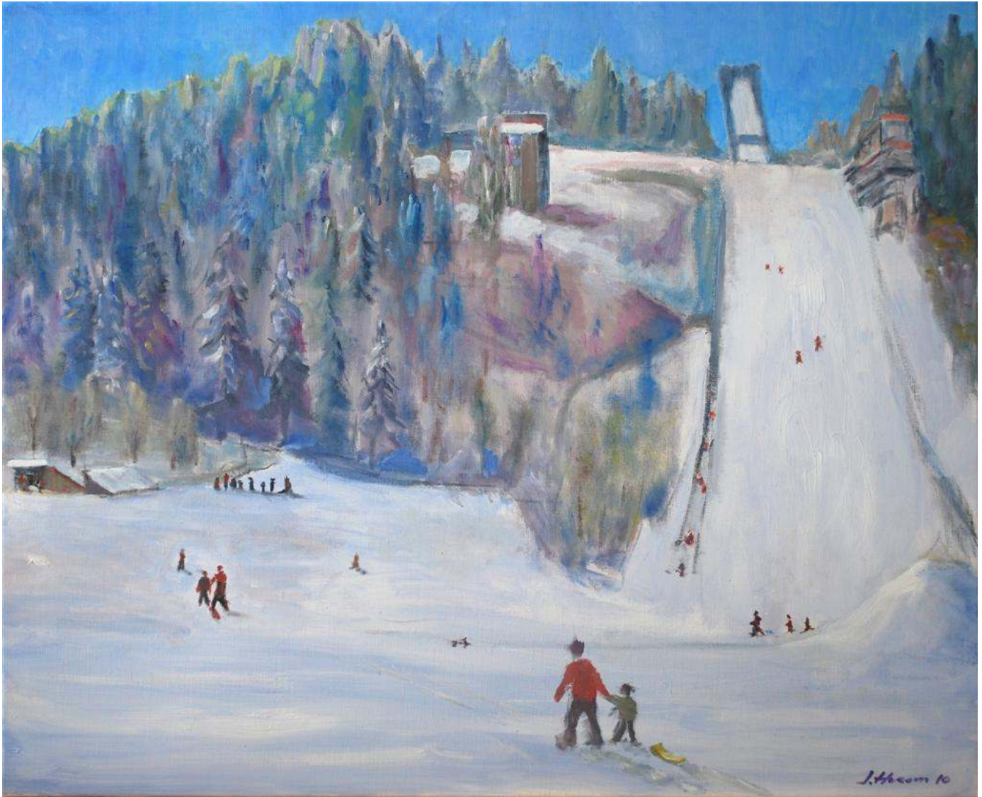
Skuibakken med Skileiken IL Jutul – Arena for mye moro og glede