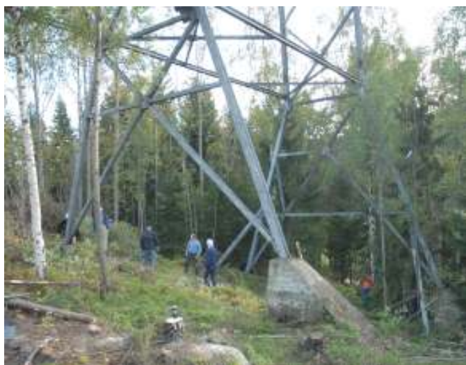
Det lysner under de store konstruksjonene

Vedlikeholds- og dugnadskomiteen. Å få satt bakken i stand har avgjørende betydning for mulighetene for aktivitetene i bakken. Det har vært flere dugnader med kvistfjerning og opprydning.