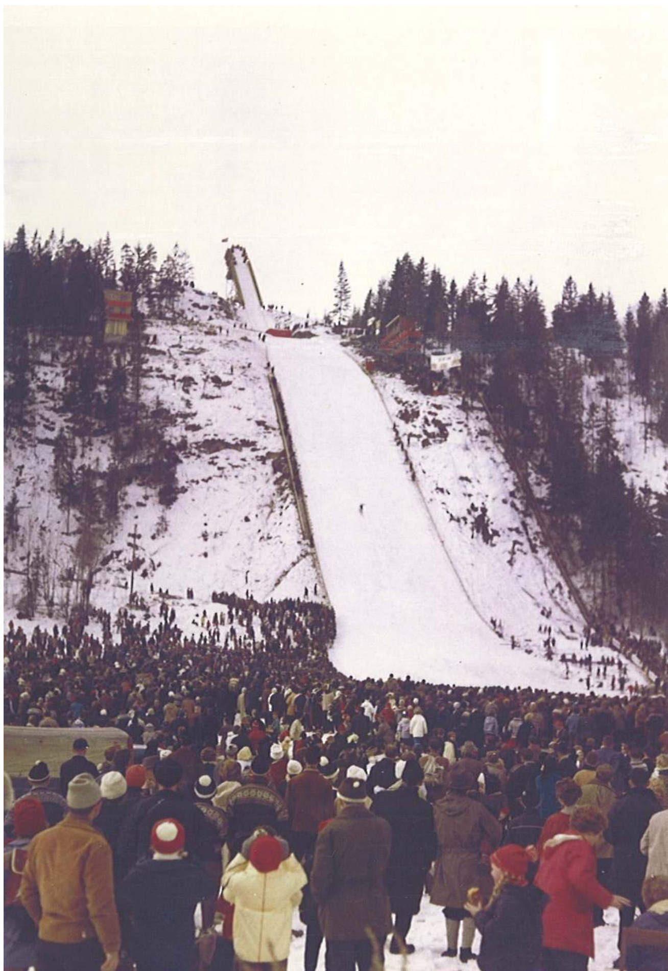
Skuibakken, NM stor bakke, 8. april 1963. Første renn etter tredje ombygning.