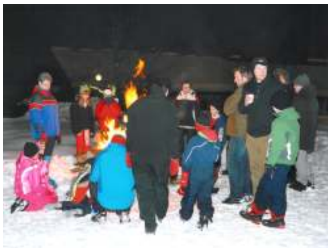
Bålvarme på sletta