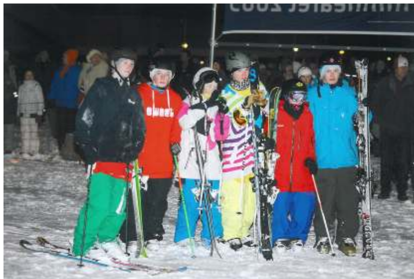
Jibbere i Skuibakken