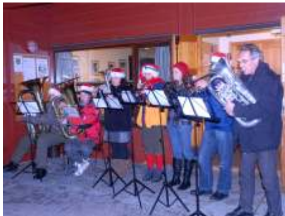
Skui Brassbands Nisseorkester

Årets tradisjonelle arrangement, første søndag i advent, ble gjennomført med en større gran og mer lys. Nå plassert i permanent fot på kulen. Skuibakken i flomlys viste seg frem med nye pærer i ovarennet. Skui Brassband skal igjen ha takk for profesjonell fremføring av kjente og kjære julemelodier. Kombinert med varm gløgg og pepperkaker og juletale, fikk små og store i en tallrik forsamling Skuibakke-entusiaster virkelig en forsmak på adventstiden. Riktignok uten sne, men appellen virket og den kom dagen etter og ligger enda!