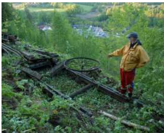
Stilanviserhjulet kom frem etter rydding

Tilbakeblikk: Flere strakstiltak ble utført i 2008: Hoppkant restaurert, sikkerhetsmessige utbedringer av fartsstillaset som har fått utbedret rekkverk og plattinger. På kongetribunen er gulv og rekkverk i adkomstvei reparert. Det største restaureringsprosjektet var fornyelse av søndre måletrapp slik at den også brukes som trimtrapp. Denne ble umiddelbart tatt i bruk og var også viktig under fredningsarrangementet året etter. I 2009 har fartsstillasets løperbanen fått ny papp og lekter, tilstandsrapport for elektrisk utstyr og anlegg og sikkerhetsmessig vedlikehold utført. Videre utbedringer vil bli utført i 2010. Dommerhuset har fått midler til maling hvor det avventes maling undersøkelser og fargevalg fra Akershus fylkeskommune. Nordre trimme/måletrapp er påbegynt. Det blir søkt om midler til fullføring i 2010. Det er også planer om historiske skilt og utbedring av trapper og rekkverk på terreng. Restaureringen skjer i samarbeid med Riksantikvaren.