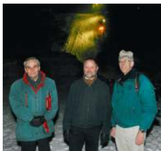
Ordføreren, Riksantikvaren og leder SBV