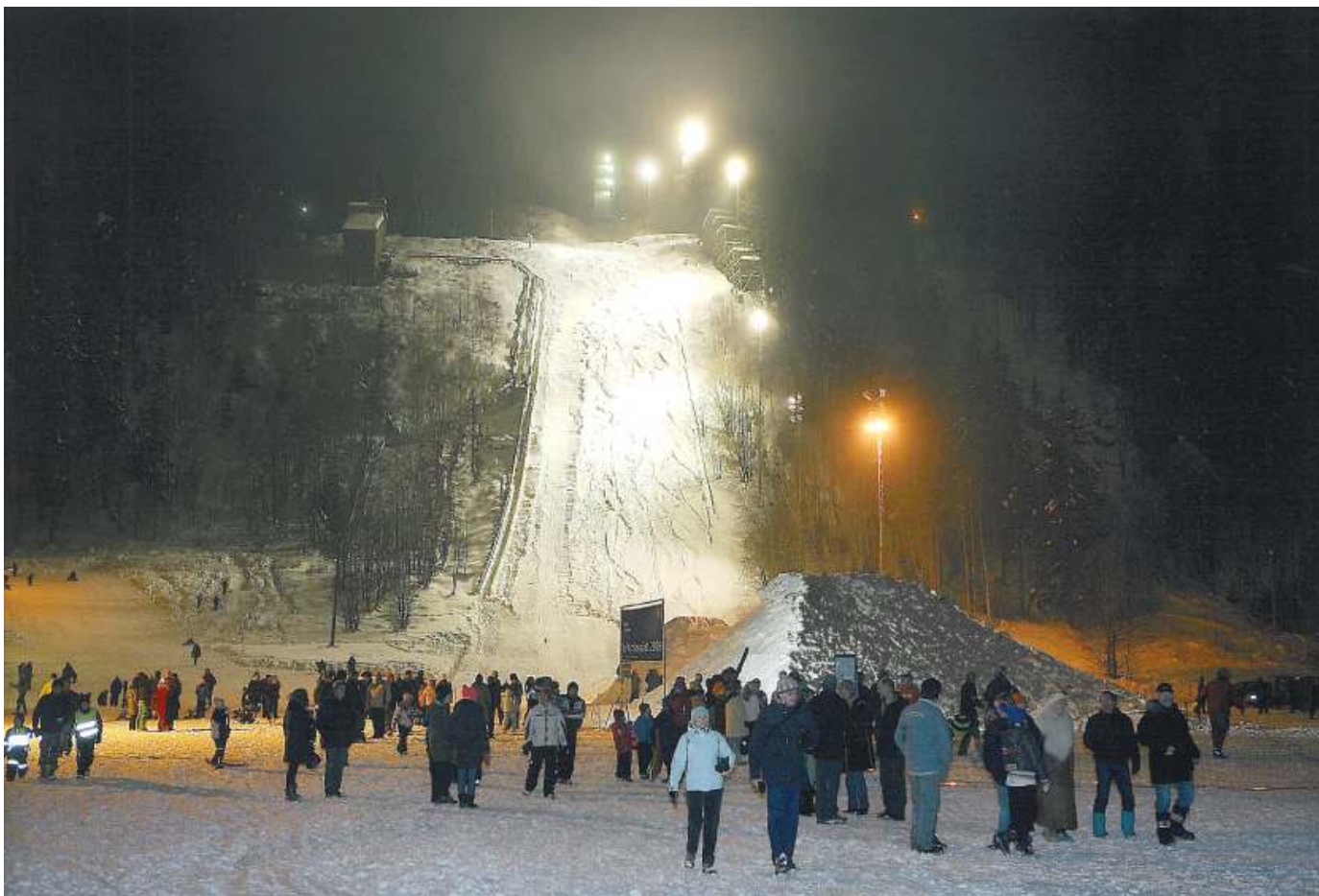
Folkefest på sletta under Frednings seremoni 24. februar 2009

I kulturminneåret 2009 ønsket som kjent Riksantikvaren å frede 12 kulturminner. Akershus fylkeskommune foreslo Skuibakken. Forslaget ble valgt av sentrale myndigheter og etter en høringsprosess og positiv innstilling fra Bærum kommunestyre ble Skuibakken fredet 24. febr 2009 som det eneste fra Akershus og eneste idrettsanlegg. Dette gjorde at vi fikk betydelig oppmerksomhet både fra Aftenposten, NRK Østlandssendingen og fra Budstikka som begge sendte TV innslag både da forslaget ble kjent og ikke minst fra fredningsseremonien hvor det igjen var hopp i bakken. Nå riktignok på sletta med "Bigjump" og twin-tip ski, med saltoer og piruetter.