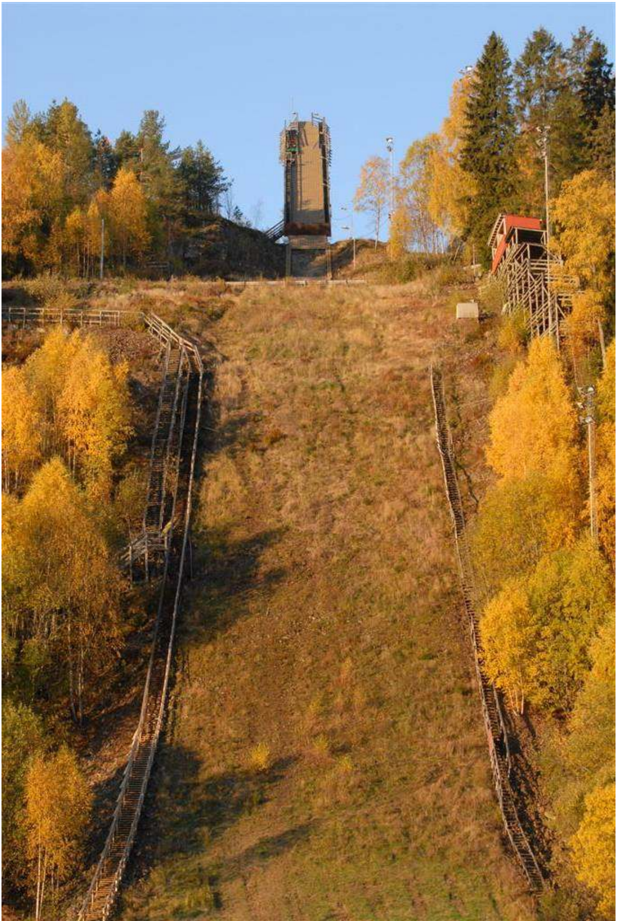
Skuibakken oktober 2009