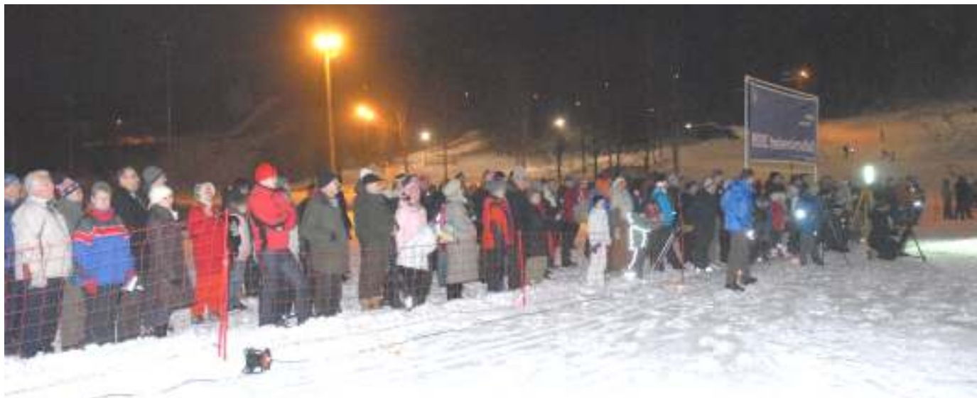
Tilskuere i Skuibakken igjen, Fredningsseremonien 24.2.2009