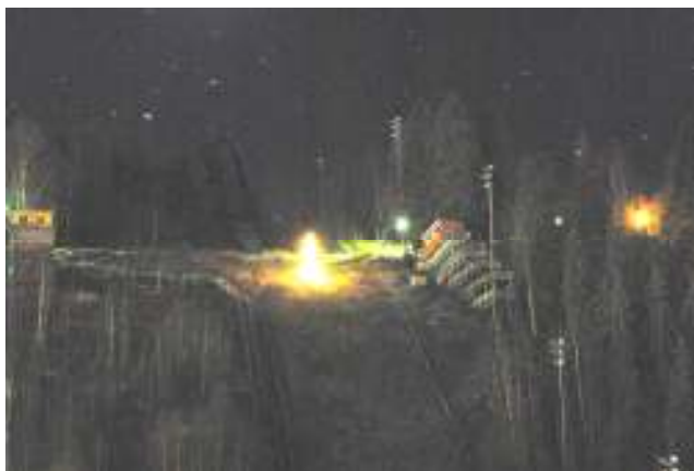
Julegranen lyser opp