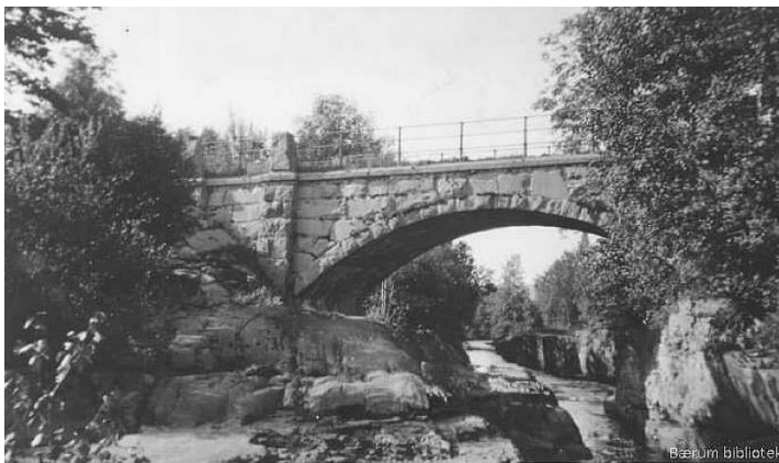
Løken steinhvelv bru 1929 fra syd

Vi starter på Skuibakkensletta med orientering om bakken. Derfra tar vi buss til Kolsås stasjon (kr 50)