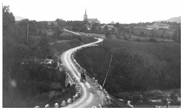
Brynsveien og Løken bru i 1904 begge