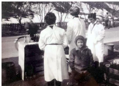
Flere steder lags ruta var det salgsboder.